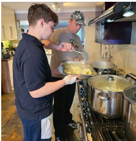
Vele hande maak ligte werk!