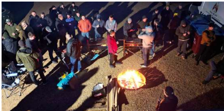
'Saam tyd in groepe maar ook tyd om te gesels in kleiner groepe'