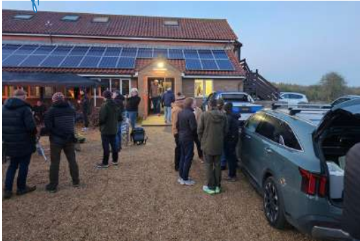
'Dit het regtig goed gewerk, en genoeg vrye tyd vir manne om te kan connect'