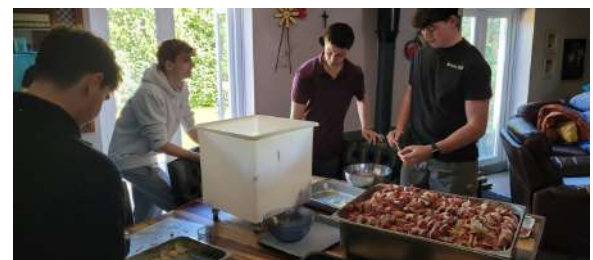
Dankie vir julle harde werk met die voorbereiding vir Saterdagdaand se braai en al die 'snacks'!