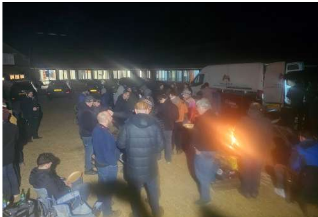
"This weekend isn't an escape; it's a sharpening of the soul."