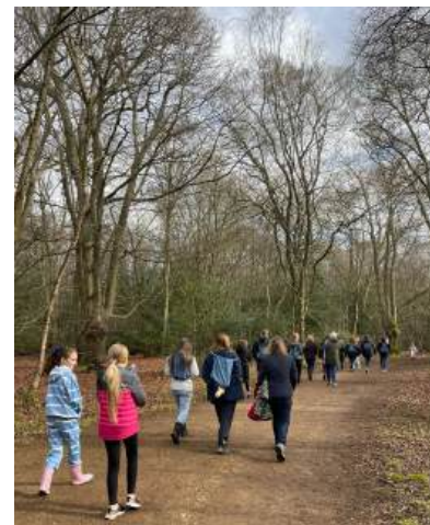
Loughton Dames stap in Epping woud- wat 'n heerlike oggend!!

Die son het heerlik geskyn en ons dames kon lekker gesels en mekaar beter leer ken.