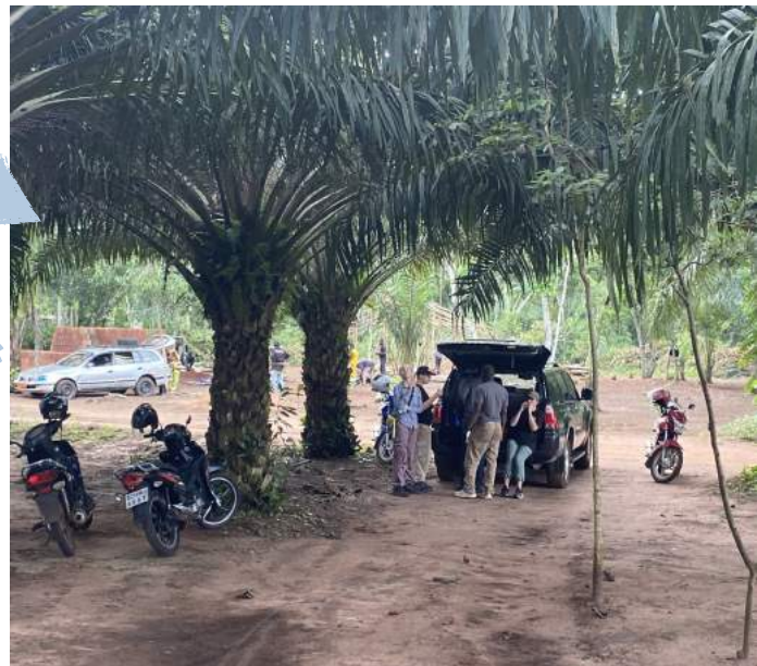
Middagete onder die bome