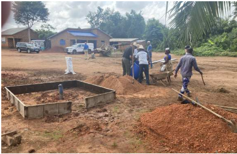
Eerste fase van beton blad

Donderdag – Dis weer 'n vroeë begin vir die span. Na Bybelstudie en ontbyt vertrek ons na 'n ander 'village' waar ons weer gaan help om 'n betonblad te lê. Dit gaan al makliker, aangesien ons weet wat op ons wag, maar die hitte en humiditeit maak dit steeds moeilik. Ons kry ook 'n lekker Afrika bui reën en vir 'n kort rukkie koel dit af.