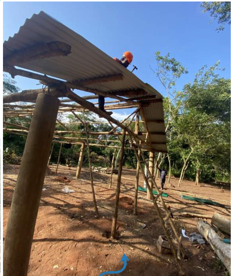
Kerk se dak gaan op.