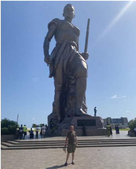
Monument van vroue vegter.

Saterdag - Vandag is ons toeriste. Ons besoek die kuns mark en die span kry geleentheid om aandenkings te koop. Ons besoek ook die standbeeld van die "warrior woman". Hierna is ons strand toe waar van ons 'n bietjie lyf kon natmaak en afkoel.