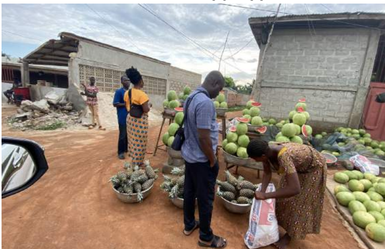
Waatlemoene en pynappels