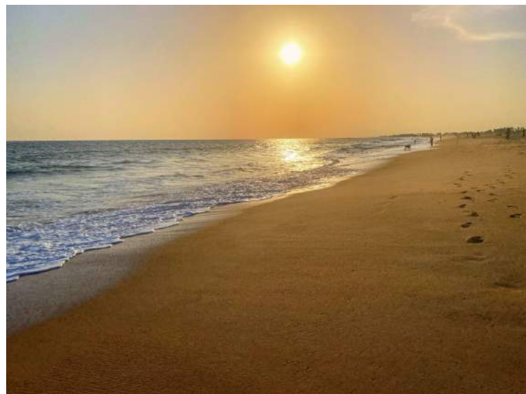
Stappie op die strand