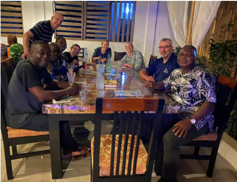
Verwelkomings ete saam met die GAiN Benin span