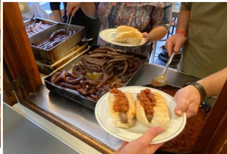
Die Pappa's braai.....